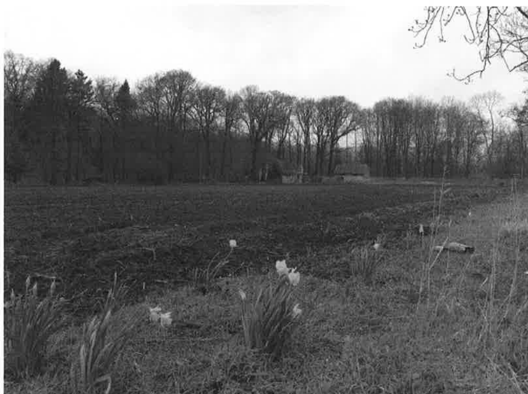
Moestuin Leyduin na de eerste grondbewerkingen